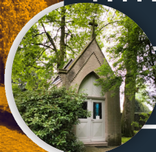
Friedhof und Garten